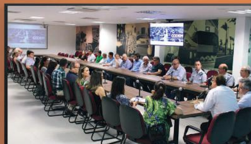
Reunião de uma das comissões de trabalho do Codem, na sede da Associação Comercial