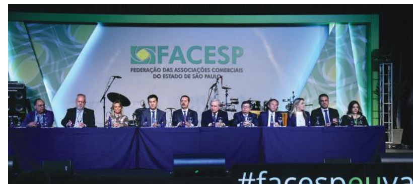
Autoridades constituídas e que se fizeram presente na abertura do evento realizado em Atibaia

Outro ponto alto do evento é a premiação entre as associações comerciais paulistas, com o Prêmio AC Mais. A associação comercial de Marília venceu todas as cinco edições. “Nossa região é forte neste sentido, com boas associações comerciais em atividade”, admitiu o dirigente que acredita em superações com as associações comerciais de Garça, Pompeia e Santa Cruz do Rio Pardo, que também já venceram o concurso que escolhe as melhores associações comerciais por categoria, por porte e por serviço oferecido.