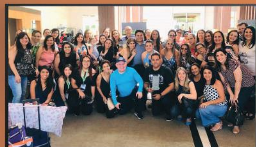
Parte da comitiva da região que esteve presente no Congresso da Fapesp na cidade de Atibaia, durante três dias