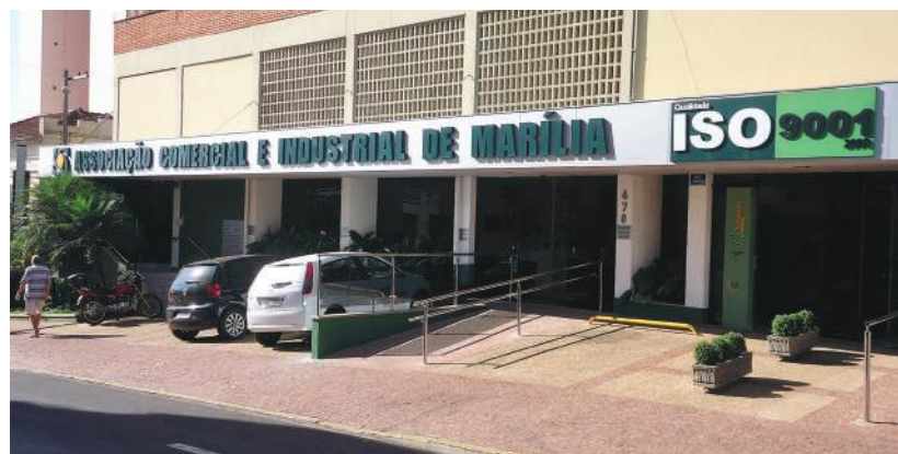
Encontro regional acontecerá na sede da associação comercial em Marília com 19 representantes.

Estiveram presentes representantes das cidades de: Rinópolis, Bastos, Parapuã, Tupã, Pompeia, Marília, Garça, Ourinhos, Ipaussu, Chavantes, Santa Cruz do Rio Pardo, Maracai, Tarumã, Assis, Echaporã, Paraguaçu Paulista, Quatá, Cândido Mota e Bernardino de Campos.