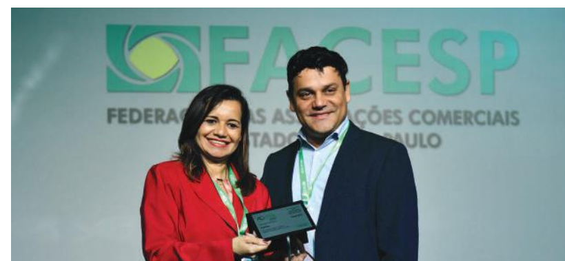
Homenagem para a associação comercial de Pompeia, que esteve entre as melhores na categoria “Produtos e Serviços”