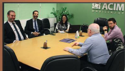
Primeiros encontros para a formação do núcleo de advogados do Empreender Competitivo de Marília