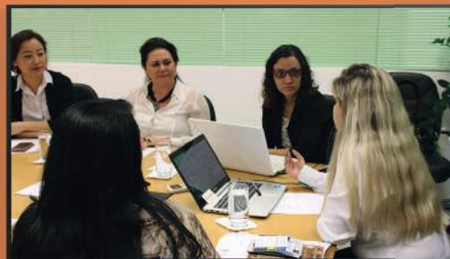
Encontro mensal das conselheiras que fazem parte da diretoria do Conselho da Mulher Empreendedora de Marília