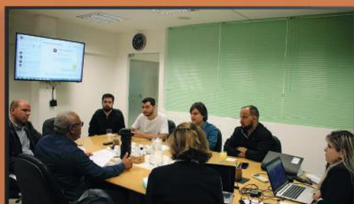
Representantes do segmento de T.I. reunidos na Acim, para o Núcleo de T.I., também do Empreender Competitivo