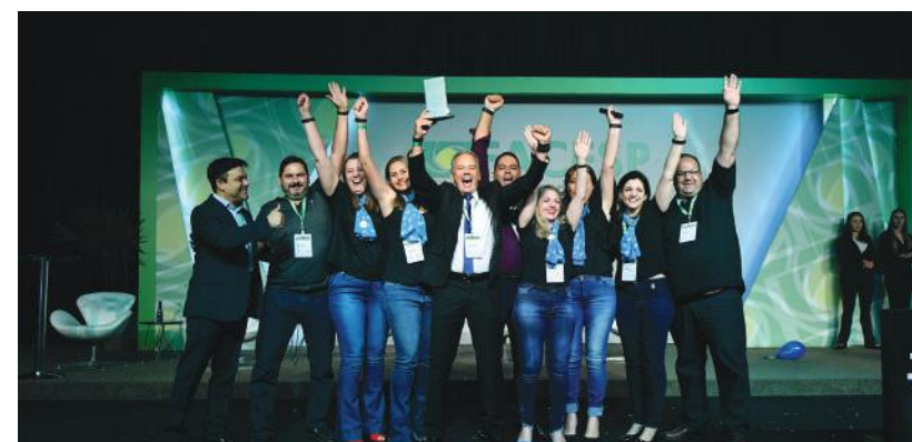
Equipe da associação comercial de Garça que foi o destaque na categoria “Desenvolvimento Local”