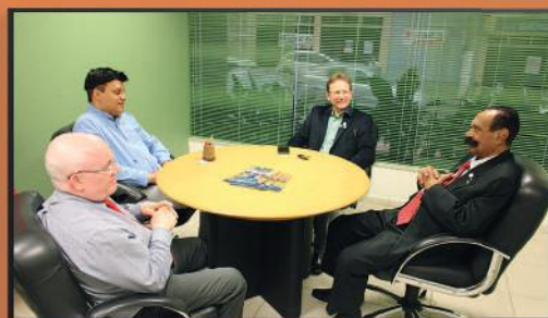
Conversa com representantes do Conselho de Biomedicina na sede da associação comercial