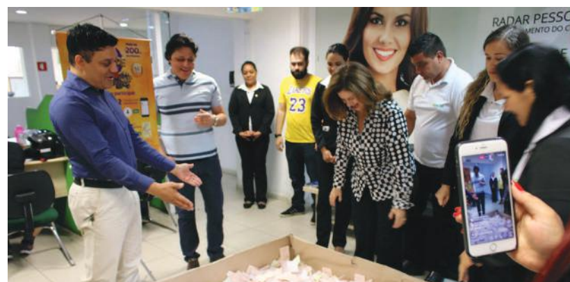
O sexto sorteio realizado pela associação comercial neste ano, num total de oito até Dezembro