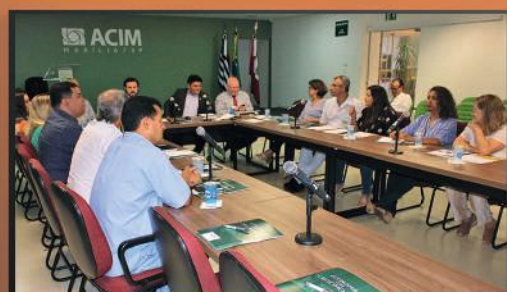
Reunião da RA 15 da Fapesp com representantes de associações comerciais do centro-oeste paulista