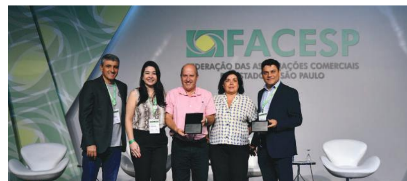
A entrega dos prêmios, para as associações comerciais classificadas na categoria “Gestão”