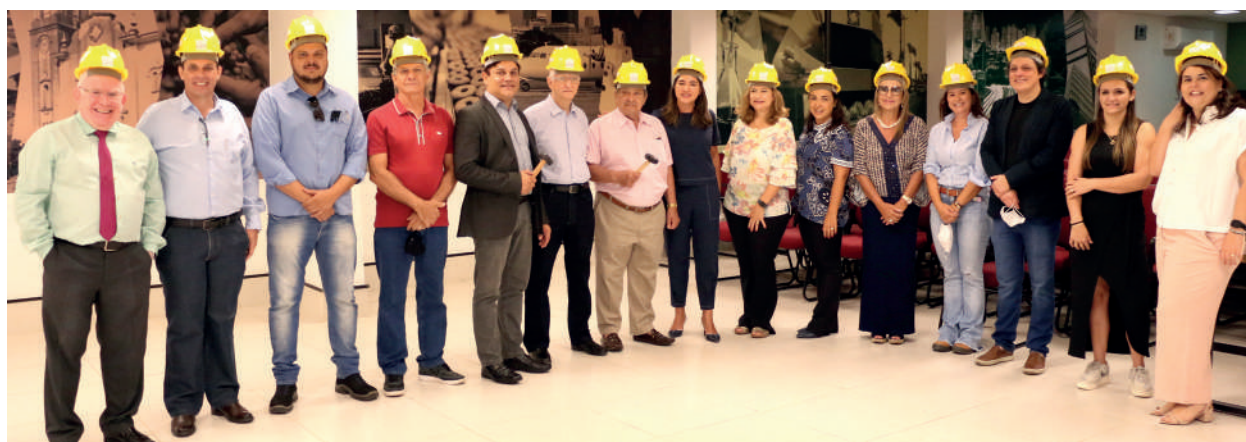
Diretorias Acim e Unimar em momento histórico