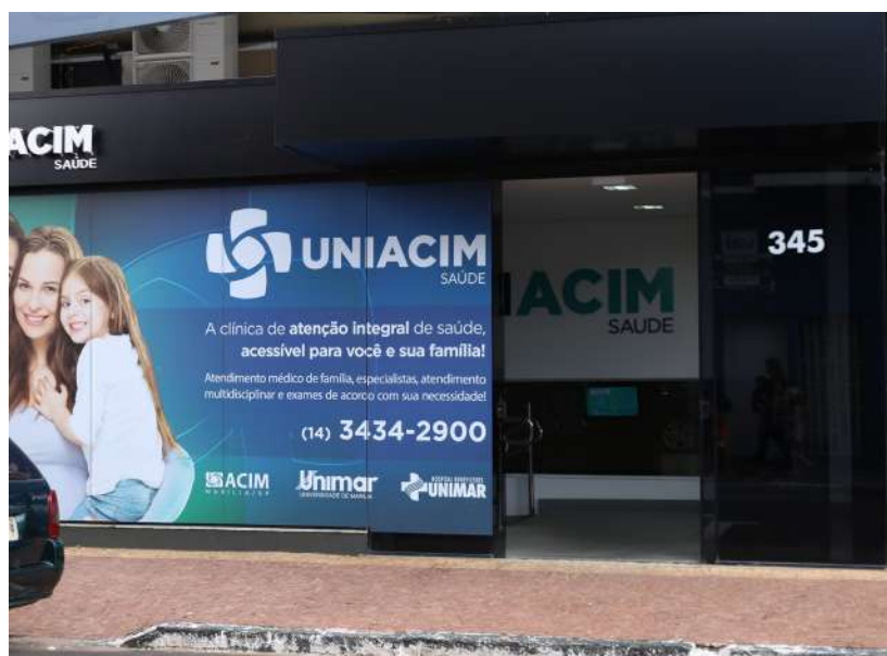
A Policlínica UniAcim é uma realidade na sede da associação comercial, graças a parceria com a Unimar

foram sempre solícitos e ajudaram muito na realização desta parceria, o que sou muito grato”, disse o dirigente da associação comercial que agilizou as obras de construção civil para que a Policlínica UniAcim fizesse parte das festividades de aniversário da associação comercial. “Tudo deu certo dentro do cronograma e já estamos atendendo em pleno vapor”, falou ao acreditar que este serviço será muito bem utilizado pelo empresariado em geral e a população de Marília. “O pessoal precisa conhecer e ver como nos preparamos”, falou ao convidar qualquer interessado em saber como é o programa, como desenvolve o serviço e quem pode e deve utiliza-lo.