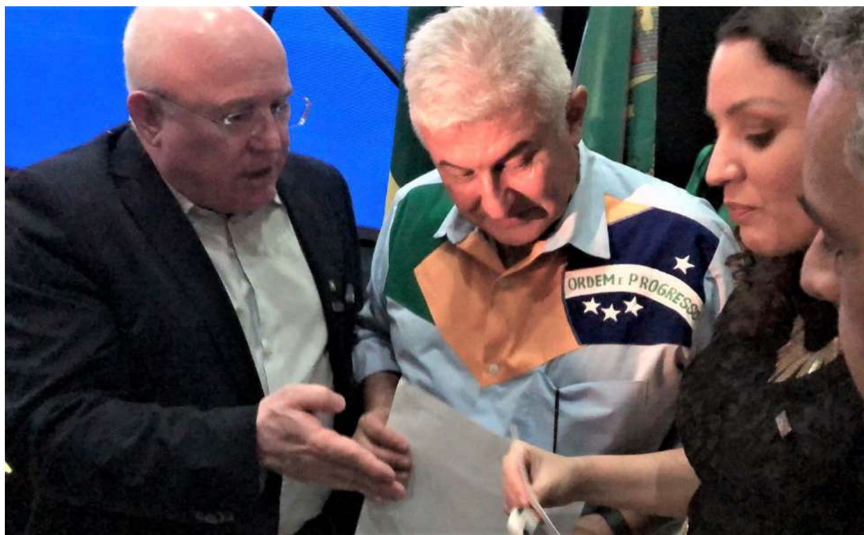
Ofício é entregue ao senador e ex-astronauta brasileiro, Marcos Pontes, para que venha a Marília para reunião de trabalho

O Connect Ambiente de Inovação idealizado pela associação comercial mariliense é um ambiente apropriado na área tecnológica que busca desenvolver ideias, soluções e empresas, principalmente as de base com tecnologia. Com uma atuação em rede, colaboração e conexão com diversos públicos e segmentos, tem como objetivo principal o fomento da ciência, pesquisa e tecnologia em favor das pessoas e organizações, com enfoque a inspirar e gerar inovação. Atualmente é composto por uma aceleradora de “startups”, incubadora virtual e instituto de pesquisa, possuindo alcance nacional por meio de parcerias estratégicas, atingindo quase 50 mil pessoas entre estudantes de graduação e pós-graduação, docentes, empresários, associados e cooperados de diversos segmentos.