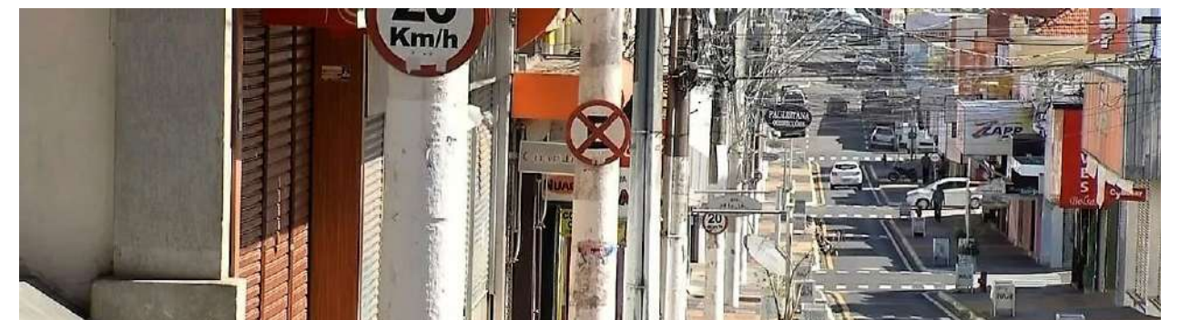
Pela primeira vez na história, lojas do comércio de Marília ficaram fechadas por vários dias em grande maioria