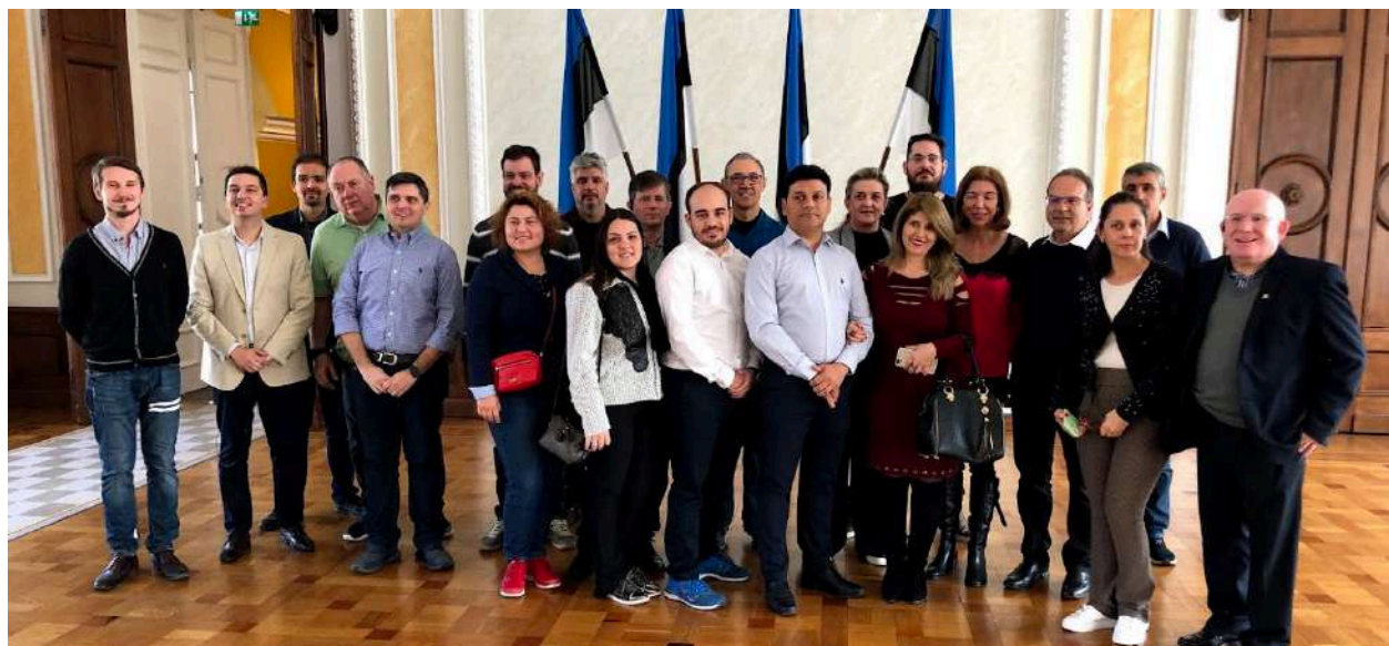
Primeira missão empresarial que a associação comercial organiza é para a Estônia em 2019. Agora todo ano tem uma