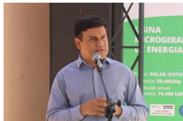
A inauguração da mini usina de energia solar é um marco e um diferencial na primeira gestão da diretoria da Acim