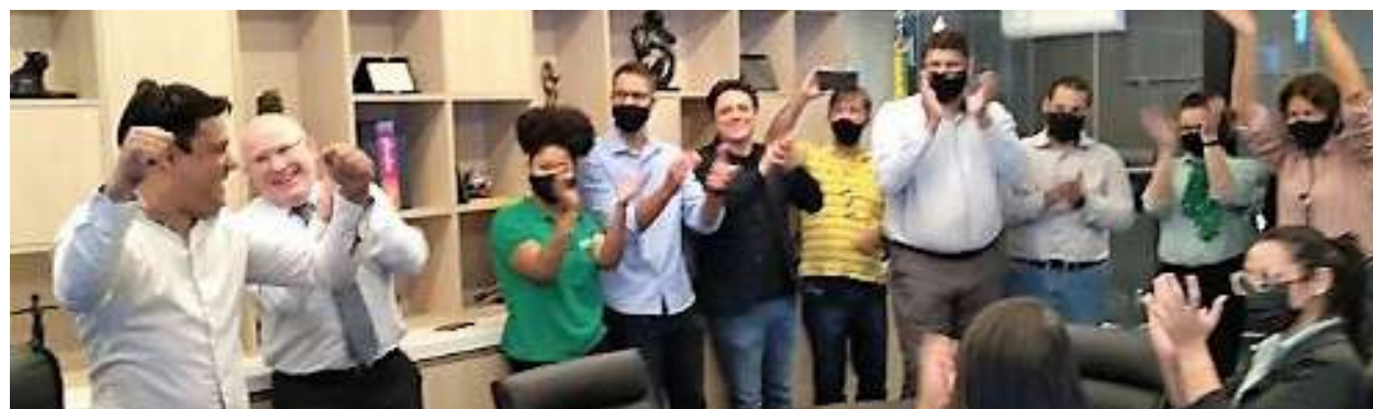
O último prêmio conquistado pela Acim foi anunciado pela Internet e a celebração aconteceu na própria sede em Marília

O Prêmio AC Mais é uma ação instituída pela Federação das Associações Comerciais do Estado de São Paulo (Fapesp), com o objetivo destacar e reconhecer as associações comerciais por meio das melhores práticas e resultados. Dentre as ações do Prêmio AC Mais destaca-se o mérito do reconhecimento às associações comerciais que atuaram na busca do alcance da missão e visão e que consequentemente obtiveram resultados que atendam às necessidades das partes interessadas: associados, colaboradores, fornecedores, sociedade e outras entidades. O Prêmio AC Mais é dirigido às associações comerciais filiadas à Fapesp, que se encontram em dia com suas obrigações junto à Federação das Associações Comerciais do Estado de São Paulo, e que atualizaram a Pesquisa de Desenvolvimento Organizacional (PDO). São reconhecidas e consideradas destaques as associações comerciais que atingiram a maior pontuação e atendam, de forma harmônica e balanceada, aos fundamentos avaliados pelos critérios do Prêmio AC Mais. O reconhecimento será feito em quatro categorias: Gestão, Desenvolvimento Local, Produtos e Serviços e Melhores Práticas Boa Vista SCPC.