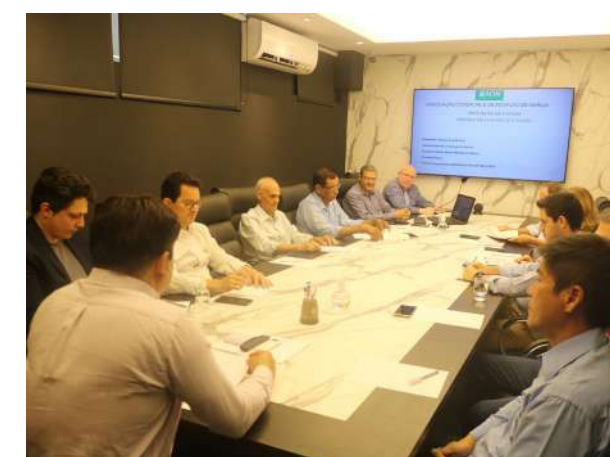
Decisões importantes foram tomadas nas duas gestões com reuniões mensais entre os diretores na discussão de temas oportunos