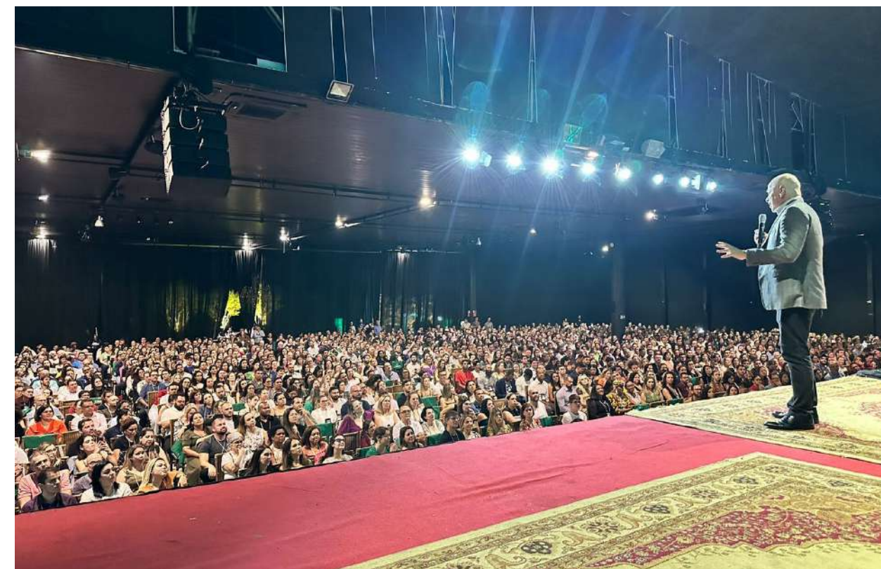
A última edição do Connect foi um sucesso e retomou a maior concentração de pessoas participantes em apenas um dia de evento

A quarta edição foi tudo diferente: data e locais