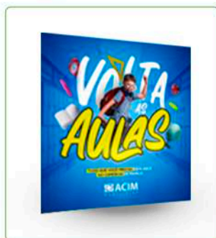
POST + STORY