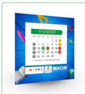
POST + STORY + BANNER DIGITAL