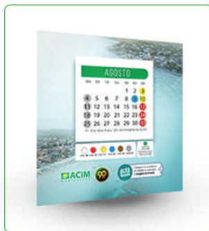
POST + STORY + BANNER DIGITAL