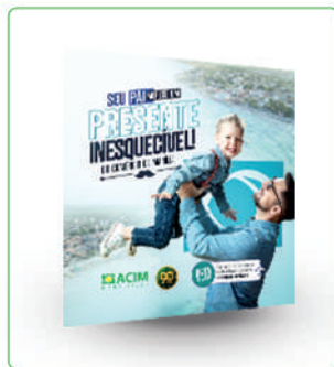
POST + STORY