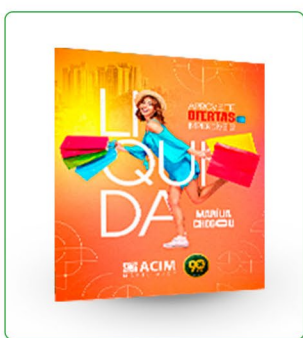
POST + STORY