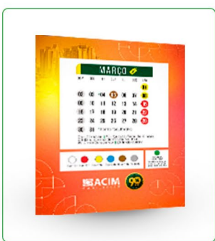
POST + STORY + BANNER DIGITAL