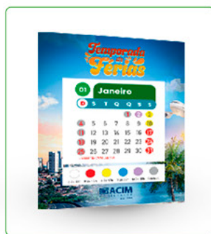
POST + STORY + BANNER DIGITAL