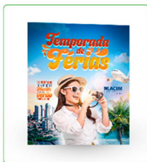
POST + STORY